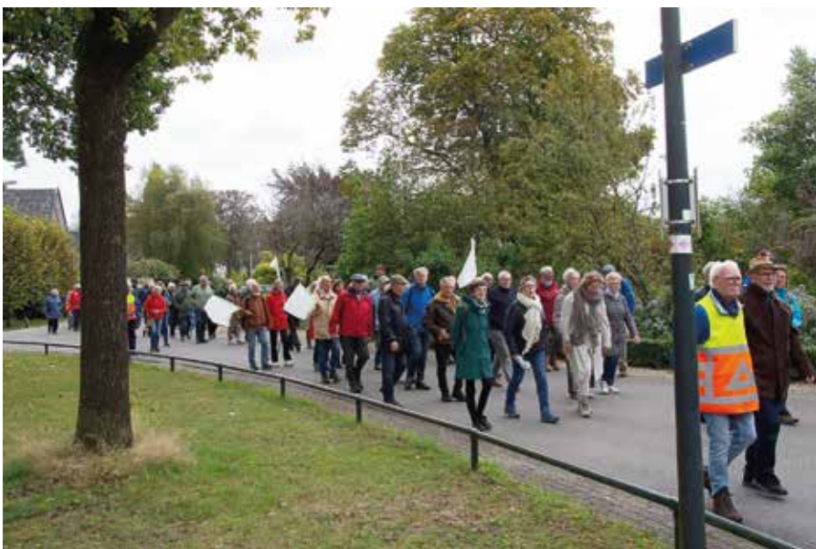
De evacués, familieleden en belangstellenden wandelden achter de jeep van het Exoduscomité en onder begeleiding van de muziek van de 48th Highlanders of Holland naar het Exodusmonument aan de Arnhemseweg in Beekbergen.

Het Exodusmonument in Beekbergen is 25 september 2014 onthuld. Het is een initiatief van de Stichting Evacuatie 1944-'45 Apeldoorn en herdenkt de evacués, maar ook de gastgezinnen die hen opvingen. De naam '1944 EXODUS 1945' verwijst naar de gedwongen evacuatie voor mensen uit Arnhem en omgeving in september 1944. De stalen boom verwijst naar de hardheid van de oorlog; de vertakkingen symboliseren de evacuatieoorden in de gemeente Apeldoorn.