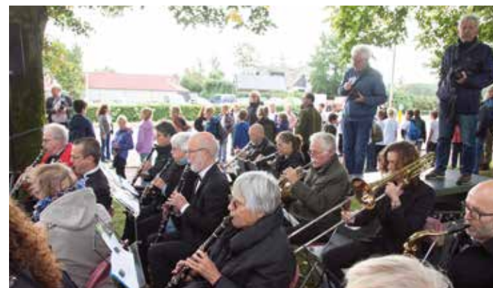
Bij het monument speelde het Harmonie-Orkest Prinses Juliana uit Beekbergen

Het Exodusmonument in Beekbergen is 25 september 2014 onthuld. Het is een initiatief van de Stichting Evacuatie 1944-'45 Apeldoorn en herdenkt de evacués, maar ook de gastgezinnen die hen opvingen. De naam '1944 EXODUS 1945' verwijst naar de gedwongen evacuatie voor mensen uit Arnhem en omgeving in september 1944. De stalen boom verwijst naar de hardheid van de oorlog; de vertakkingen symboliseren de evacuatieoorden in de gemeente Apeldoorn.