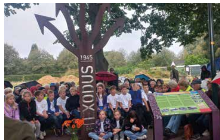
Leerlingen uit klas 7/8 van de openbare basisschool in Beekbergen hadden bloemen gelegd bij het monument dat hun school heeft geadopteerd.